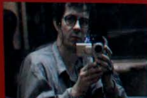
Avant sa «rencontre» avec la pierre...