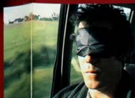
... on le conduit vers une destination inconnue. Au fond de ces escaliers...

LES YEUX BANDÉS SUR LA ROUTE QUI LE MÈNE À LA PIERRE D'UNSPUNNEN