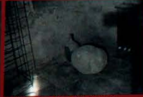
... la fameuse pierre d'Unspunnen.