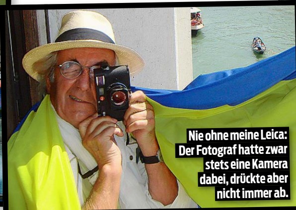
Nie ohne meine Leica: Der Fotograf hatte zwar stets eine Kamera dabei, drückte aber nicht immer ab.