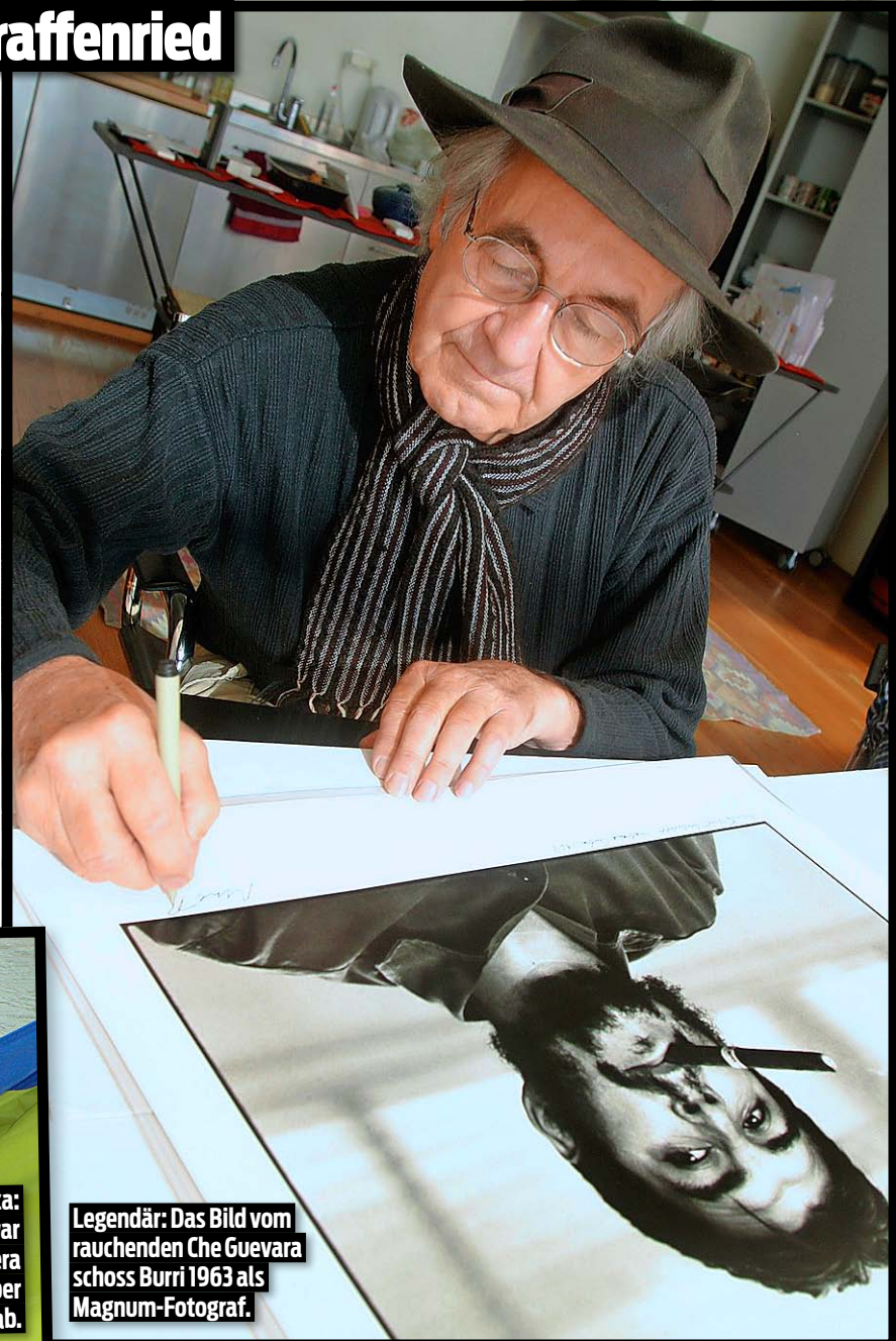
Legendär: Das Bild vom rauchenden Che Guevara schoss Burri 1963 als Magnum-Fotograf.